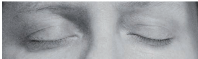
Gut schlafen, gut fühlen.