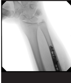
Korrekturosteotomie mittels winkelstabiler Platte bei angeborener Überlänge der Elle