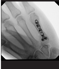
Korrektur mittels basisnaher Osteotomie und winkelstabiler Plattenosteosynthese