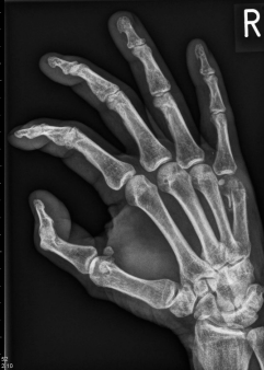
Drehfehler nach mittels Gipsruhigstellung behandelter Mittelhandfraktur