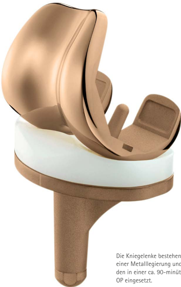
Die Kniegelenke bestehen aus einer Metalllegierung und werden in einer ca. 90-minütigen OP eingesetzt.