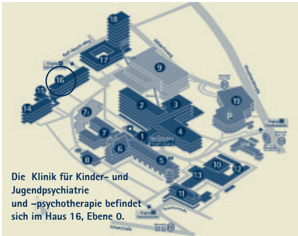
Die Klinik für Kinder- und Jugendpsychiatrie und -psychotherapie befindet sich im Haus 16, Ebene 0.