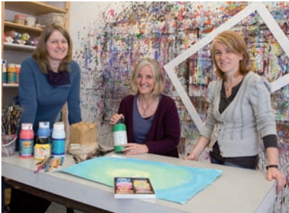
Team der Kunsttherapie