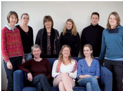
Team der Station K90P

Das Behandlungskonzept ist psychodynamisch orientiert, auf einem psychoanalytischen Grundverständnis basierend, in der Therapie kommen darüber hinaus unterschiedliche Behandlungsverfahren zur Anwendung wie Verhaltenstherapie, Traumatherapie, Soziotherapie und bei entsprechender Notwendigkeit auch Pharmakotherapie. Die Behandlungen werden von multiprofessionellen Teams (s.o.) durchgeführt.