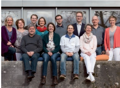
Team der Station P18

In der stationären Psychotherapie für Erwachsene liegt der Schwerpunkt der multimodalen Behandlung in der hochfrequenten Einzelpsychotherapie. Dabei ist