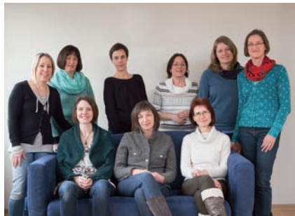
Team der Station P21T