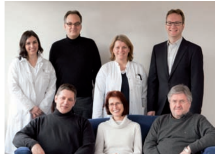
Team der Oberärzte

Zu Beginn der Behandlung wird mit dem Patienten ein individueller Behandlungsplan erstellt, dabei kommen folgende Therapien zur Anwendung: