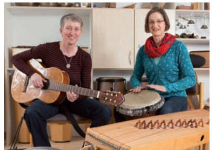
Team der Musiktherapie