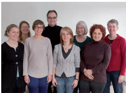
Team der Station P19

In der Tagesklinik für Erwachsene stehen 2 Behandlungsgruppen mit je 10 Behandlungsplätzen zur Verfügung. In einer der tagesklinischen Behandlungsgruppen besteht ein Spezialsetting für Patientinnen und Patienten mit Traumafolgestörungen . Das Behandlungsangebot richtet sich an Menschen mit traumatischen Lebenserfahrungen (z. B. Erleben von körperlicher und sexueller Gewalt, Verkehrsunfälle, Arbeitsunfälle), die durch die Erlebnisse an einer Traumafolgestörung erkrankt sind. Im Rahmen des dreiphasigen Modells der Traumatherapie (1. Stabilisierung, 2. Exposition, 3. Integration) liegt der Schwerpunkt der therapeutischen Arbeit in stabilisierenden und im Bedarfsfall exponierenden Behandlungstechniken. Das Angebot richtet sich an Patienten aus dem Einzugsgebiet von Stadt