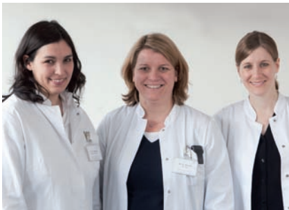
Team Psychosomatischer Konsiliar- und Liaisondienst

körperlichen Erkrankungen und Kriseninterventionen bei psychischen Ausnahmesituationen. Ein Schwerpunkt liegt dabei in der therapeutischen Begleitung und Betreuung von Patientinnen und Patienten mit Krebserkrankungen (Psychoonkologie). Im Rahmen des Liaisondienstes werden die Palliativstation und die Abteilung für Gynäkologie und Geburtshilfe mitbetreut.