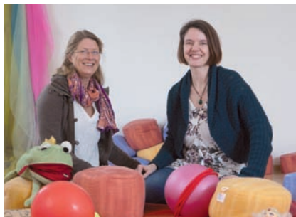
Team der Bewegungstherapie